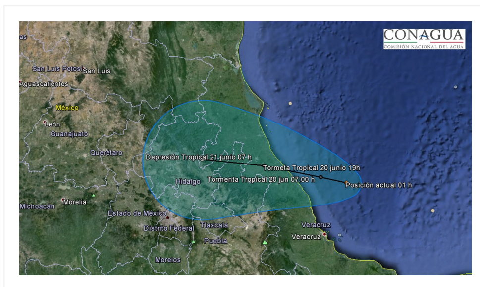
Imagen de trayectoria de la Depresión Tropical "CUATRO"